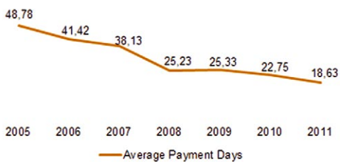
Average Payment Days for Due date Invoices

από το στάδιο pre-collections έως τη δικαστική προσφυγή και προσφέρει ένα σύνολο δυνατοτήτων όπως: • Σχεδιασμός και Υλοποίηση Στρατηγικής: Η εφαρμογή παρέχει ένα σύγχρονο εργαλείο ανάπτυξης στρατηγικής, μέσα από ένα εύχρηστο και μοντέρνο περιβάλλον χρήσης, το οποίο επιτρέπει την εύκολη εισαγωγή κανόνων με ταξινόμηση ανά περιπτώσεις και καθορισμό διαφορετικών σεναρίων. • Καθορισμός Δυναμικών Ουρών με βάση τη θεωρία των Dictates: Η έννοια και η χρήση των Dictates, στηριζόμενη στη θεωρία γράφων, επιτρέπει την ομαδοποίηση παρόμοιων περιπτώσεων πελατών σε ουρές, με στόχο την αποτελεσματικότερη διαχείριση του χρέους. • Δυναμική Επικοινωνία σε πραγματικό χρόνο: Η εφαρμογή ενοποιείται με την υπάρχουσα υποδομή, αξιοποιώντας την αρχιτεκτονική SOA, προκειμένου να διευκολύνει την ανταλλαγή δεδομένων, επιχειρηματικών κανόνων, διαδικασιών και λειτουργιών σε κανάλια. • Διαχωρισμός Πελατολογίου: Το πελατολόγιο διαχωρίζεται είτε βάση στοιχείων που προέρχονται από τρίτα συστήματα (CRM), είτε βάση οικονομικών ή στατιστικών δεδομένων, ώστε να εφαρμοστεί η βέλτιστη στρατηγική αντιμετώπισης του χρέους. • Αυτοματισμοί Ροών Εργασίας: Προσφέρονται πλήρως διαμορφώσιμες ροές εργασίας