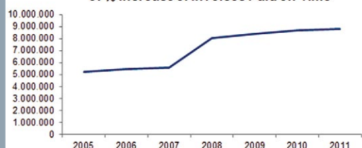
57% Increase of Invoices Paid on Time

Από τις μέχρι τώρα εγκαταστάσεις, έχουν προέλθει τα παρακάτω αποτελέσματα μέσα από τη χρήση του «SynCHORDIA Debt Management & Recovery» • Μείωση Συνολικού Κόστους Διαχείρισης Χρέους κατά 25%-40%. • Αύξηση του αριθμού των πληρωμών που πραγματοποιήθηκαν νωρίτερα από την ημερομηνία λήξης της προθεσμίας κατά 66%. • Μείωση του αριθμού των ληξιπρόθεσμων οφειλών κατά 57%. • Μείωση του αριθμού των διαγραφών και διαρροών του χρέους μέχρι και 5%. • Μείωση του λειτουργικού κόστους των Call Centers κατά 20%. • Αφαίρεση Συντηρήσεων παλιών αναποτελεσματικών μεθόδων και εφαρμογών. • Αύξηση αποτελεσματικότητας του κύκλου συλλογής χρέους. • Βελτίωση Εξυπηρέτησης και Διατήρηση Πελατών.